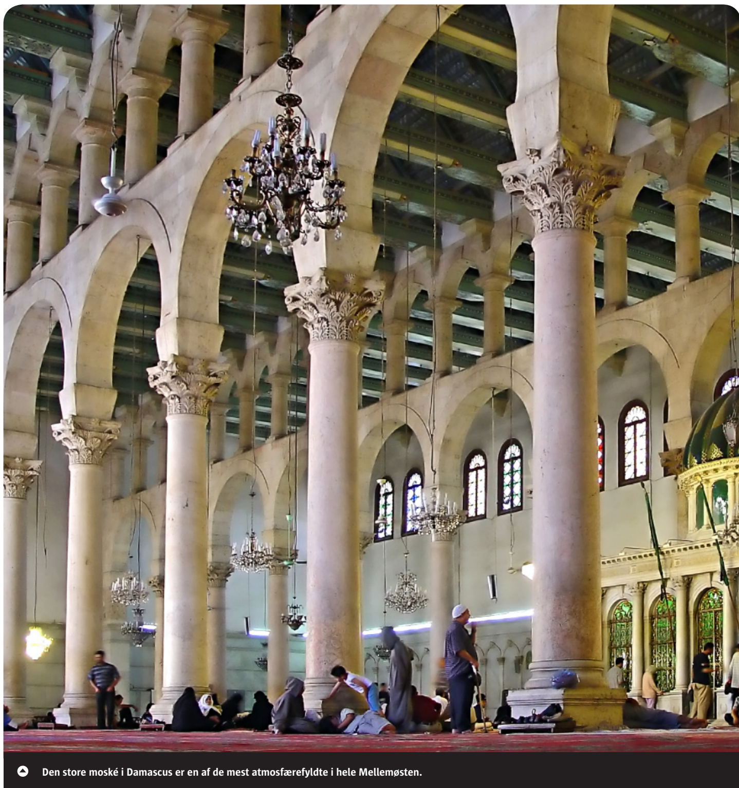
👉 Den store moské i Damaskus er en af de mest atmosfærefyldte i hele Mellemøsten.

Formiddagen er afsat til at gå egne veje i Damaskus gamle bydel, hvor små butikker og hyggelige tehuse lokker med gode tilbud. Efter frokost kører vi til lufthavnen for at påbegynde hjemrejsen mod København, hvor der er ankomst sidst på aftenen.