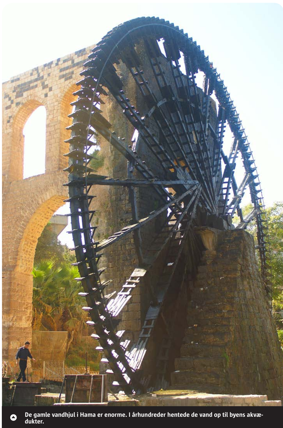
► De gamle vandhjul i Hama er enorme. I århundreder hentede de vand op til byens akvædukter.

Det meste af dagen går med at udforske Aleppo. Byen var i sin storhedstid en af