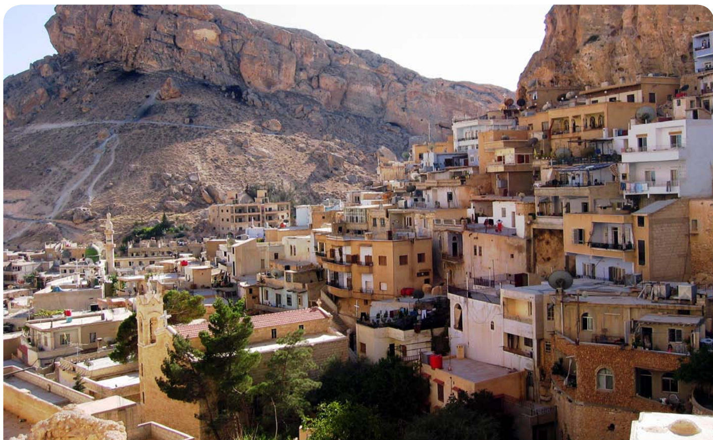
📍 Husene i Maalula ligger klistret op ad klippeskråningerne. Kupler og kristne kirkespir rager op over landsbyens flade tage.

man stadig finde folk, som taler aramæisk. Sproget, som man talte på Jesu tid. En del af byens indbyggere er muslimer, men hovedparten er græsk-katolske og græsk-ortodokse. Vi besøger to af byens klostre, det græsk-ortodokse Skt. Thekla og det græskkatolske Skt. Sergius. Sidstnævnte opført med genbrug af byggesten fra et gammelt romersk tempel for vinguden Bacchus. Fra Maalula fortsætter vi ind i Ansariyebjergene, og pludselig kan vi se den. Som en mægtig ørnerede højt oppe på en klippe ligger Krak des Chevaliers, verdens største og mest velbevarede korsridderborg. Borgen blev oprindeligt opført af Emiren af Aleppo i 1031, men under det første korstog i 1091 blev borgen erobret af de kristne korsfarere. Krak des Chevaliers blev senere overdraget til Johannitterordenen, der måske er bedre kendt som Malteserordenen. De udbyggede og forstærkede borgen, der blev deres hovedkvarter i Det Hellige Land. Her levede ordenens stormester sammen med 50-60 munke og omkring 2.000 kristne stridsmænd. Araberne forsøgte i flere omgange at indtage borgen, men hver gang blev de slået tilbage. Selv den berømte hærfører Saladin måtte give fortabt. Det siges, at han opgav sit forehavende allerede ved