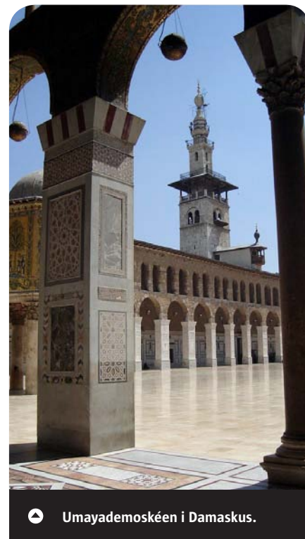
Umayyademoskéen i Damaskus.

Eventyret begynder i Syriens hovedstad Damaskus. Vi følger i Paulus fodspor gennem en af verdens ældste byer og vandrer gennem basarens labyrint af smalle gader. Her arbejder bagere, skræddere og smede for åbne døre i trange værksteder, og duften af krydderier og nybagt brød blander sig med lugten af sød tobak fra tehusenes boblende vandpiber. Rejsen fortsætter til den maleriske landsby Maalula i bjergene. Her taler man stadig aramæisk, som man gjorde det på Jesu tid. Forude venter verdens største korsridderborg og den gamle karavaneby Aleppo, der var et vigtigt stop på Silkeruten. Byen rummer stadig en af Mellemøstens største basarer og det er en helt særlig oplevelse at gå på opdagelse i de gamle handelsgader, der kun har ændret sig meget lidt siden Marco Polos tid. Afslutningsvis drager vi til Palmyra, hvorfra den excentriske dronning Zenobia regerede over dele af romerriget, inden hendes hovmod stod for fald.