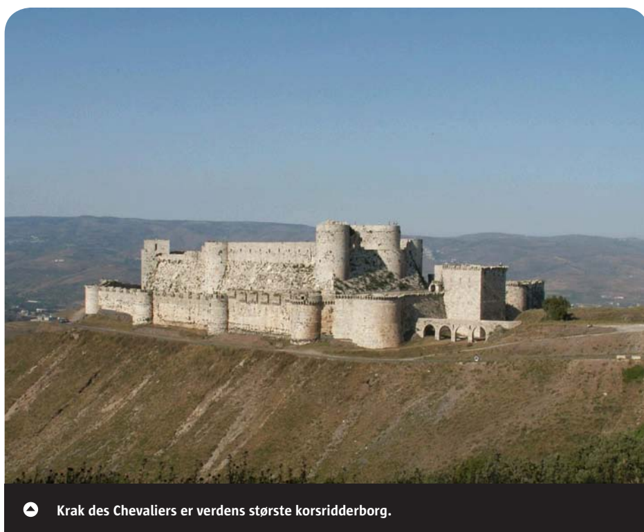
Krak des Chevaliers er verdens største korsridderborg.

Damaskus er en af verdens ældste byer, og i den gamle bydel fornemmer man stadig kulturens og historiens vingesus. Som når vi vandrer ad Via Recta, Den Lige Gade. Det var denne gade Ananias blev sendt til af Jesus for at banke på døren til Judas hus. Her ville han finde en mand ved navn Saulus. En jødisk mand, der foragtede kristendommen, forfulgte de kristne og som nu var blevet blind efter at have mødt Jesus på sin vej ind mod Damaskus. Ananias forklarede den blinde, at Jesus havde sendt ham. Han lagde sine hænder på Saulus, der fik sit syn tilbage. Oplevelsen blev et vendepunkt for Saulus. Han lod sig døbe og blev under navnet Paulus kendt som en af kristendommens store forkæmpere. Hans tidligere allierede blev imidlertid rasende over hans forræderi og sendte folk af sted, der skulle slå ham ihjel. Men Paulus undslap på eventyrlig vis, da han lod sig hejse over bymuren gemt i en kurv. Via Recta fører os ind i basarens labyrint af smalle gader, hvor bagere, snedkere, smede og skræddere arbejder for åbne døre i trange værksteder. Duften af nybagt brød og eksotiske krydderier blander sig med duften af sød tobak fra tehusenes vandpiber. Hver en gade og