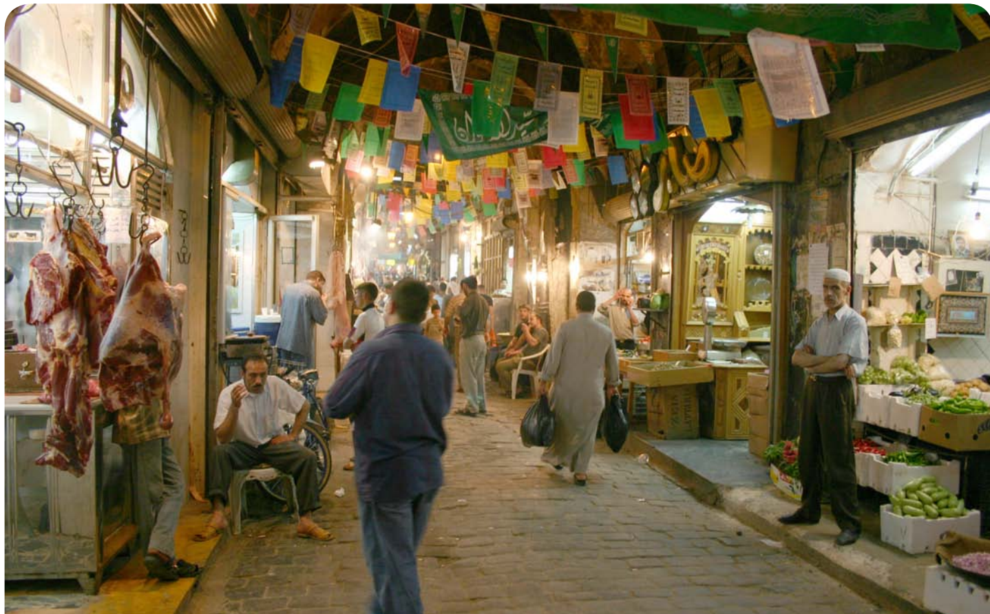
📍 Souken i Aleppo er en af de største og mest fascinerende i hele Mellemøsten.

Som en af de strategisk vigtigste oaser på handelsruterne mellem Kina, Irak og Mellemøsten, oplevede Palmyra sin storhedstid omkring 200 år før Kristus. Ikke mindst udnævnelsen til en romersk koloni hjalp til med at sætte gang i konstruktionen af imponerende arkader, gader, statuer og templer. Vi skal besøge nogle af de væsentligste ruinkomplekser og høre mere om den legendariske dronning Zenobia, der overtog styringen af riget efter hendes mand under mystiske omstændigheder blev myrdet. Zenobia var særdeles velbegavet og forstod sig på det politiske spil, der foregik i kulissen takket være sine lingvistiske evner og hendes forførende skønhed. Optændt af hendes succes og ambitioner besluttede hun sig for at erobre alle Roms territorier. Det lykkedes at erobre Syrien, Egypten samt overtage styringen af de vigtigste asiatiske områder, hvorved hun kom til at kontrollere søvejene til og fra Sydøstasien. Hun ændrede titel til Augustus og fik mønter præget med hendes billede, inden det lykkedes kejser Aurelian at stable en hær på benene, der var stærk nok til at erobre det tabte land tilbage og belejre Palmyra,